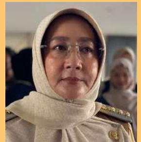
SRI JUNIARSIH Bupati Berau

Selain memberikan dukungan moral, Sri Juniarsih juga menitipkan pesan penting mengenai ketulusan hati dan disiplin. Mengingat kesempatan berangkat ke Tanah Suci adalah anugerah besar yang tidak didapatkan oleh semua orang karena antrean yang panjang, kedisiplinan terhadap aturan selama di Arab Saudi menjadi hal yang mutlak