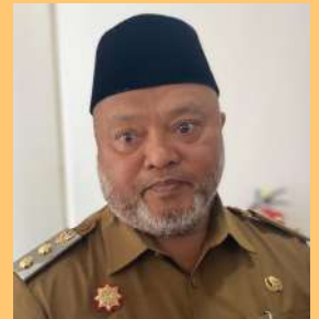
GAMALIS Wakil Bupati Berau

Evaluasi diperlukan untuk menentukan apakah sebuah program masih layak dilanjutkan atau perlu diperbaiki ber-