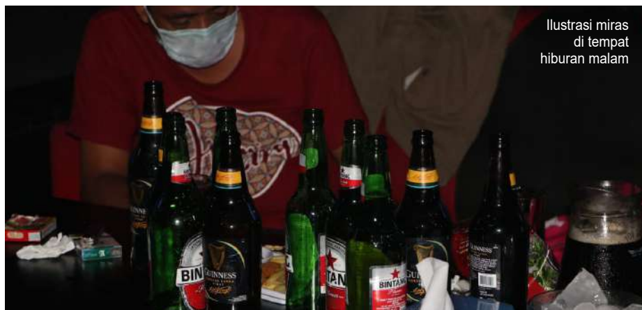
Ilustrasi miras di tempat hiburan malam

Meski begitu, Suparjan mengaku tidak merasa terganggu selama keberadaan THM dan peredaran miras tidak menimbulkan keresahan dan masih dalam batas aturan.