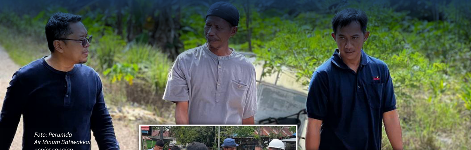
Foto: Perumda Air Minum Batiwakkal genjot capaian 25.000 sambungan rumah hingga 2026.