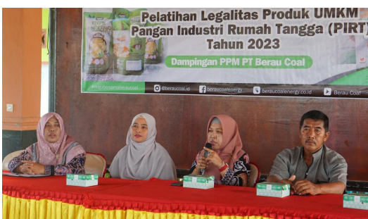
Foto: PT Berau Coal saat memberikan pelatihan legalitas produk UMKM di Labanan Jaya, Teluk Bayur.